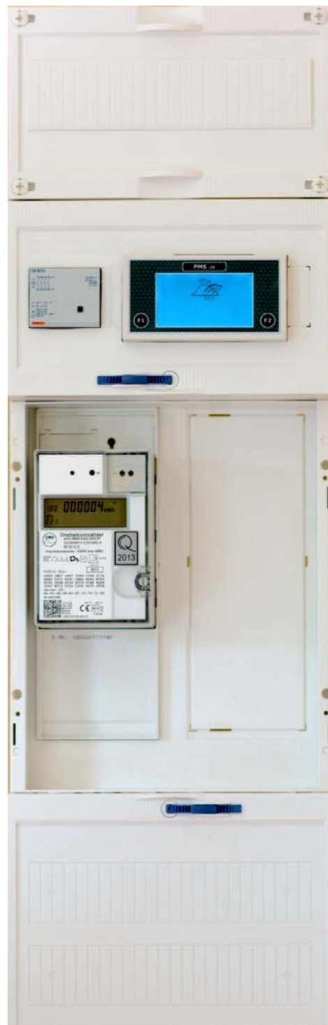
Abbildung eHZ Neuanlage mit pms i30 und EMH Stromzähler