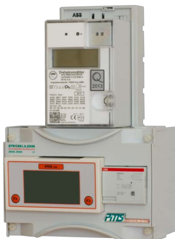
Ausführung für Bestandsanlagen in BKE-MARS-Einheit komplett einbaufertig.